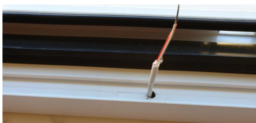
← Εικόνα 3

Στο σημείο που έχετε επιλέξει, κάντε μία τρύπα το πολύ 6 mm, στο σταθερό μέρος του κουφώματος και περάστε το καλώδιο του συναγερμού, όπως φαίνεται στη εικόνα 3.