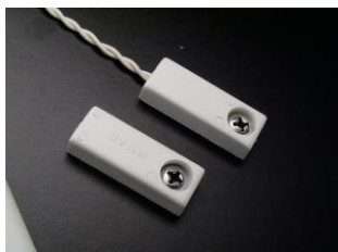
← Εικόνα 1

Η επαφή MV-1981 απεικονίζεται στην εικόνα 1